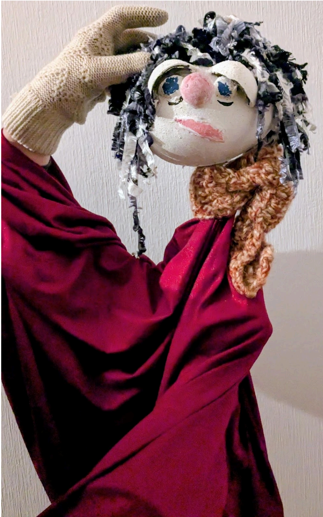
Improvisierte Figuren aus dem Material heraus